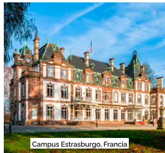
Campus Estrasburgo, Francia