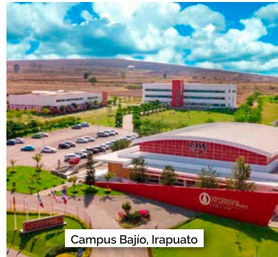
Campus Bajío, Irapuato