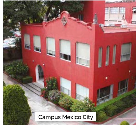
Campus Mexico City