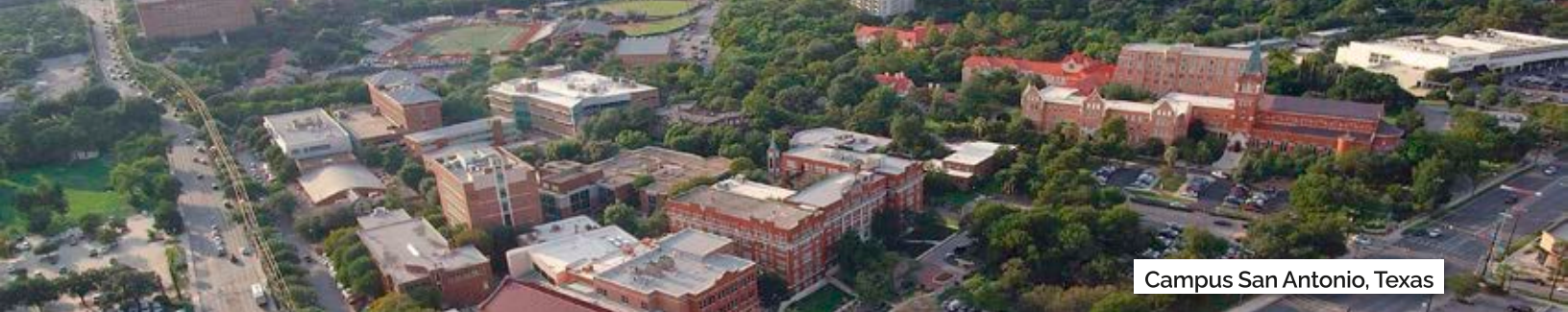
Campus San Antonio, Texas