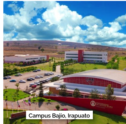
Campus Bajío, Irapuato