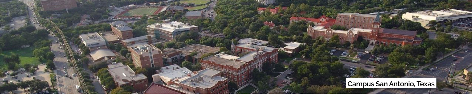
Campus San Antonio, Texas