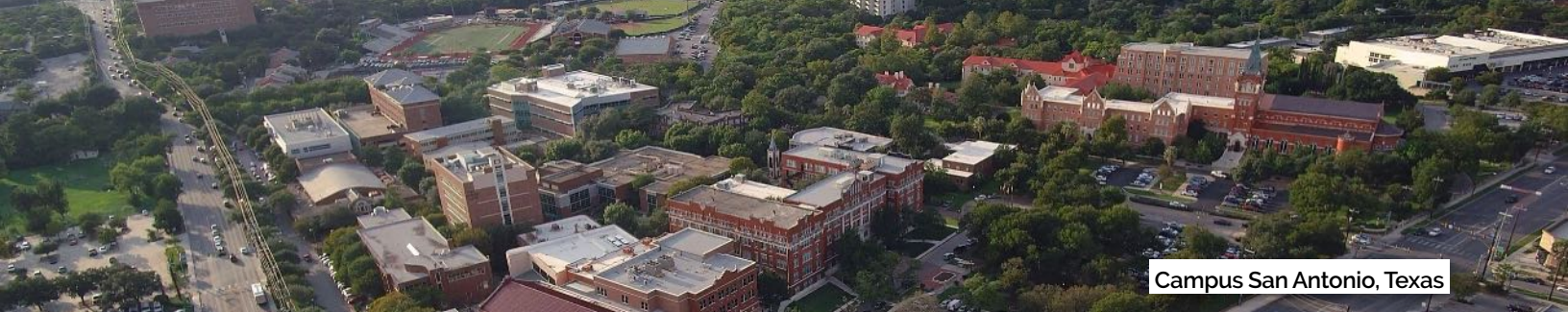
Campus San Antonio, Texas