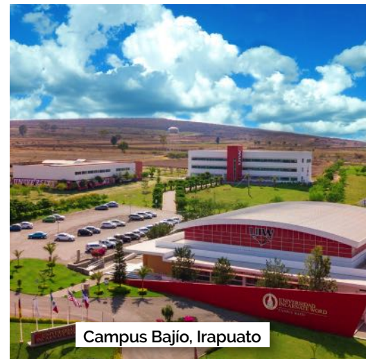
Campus Bajío, Irapuato