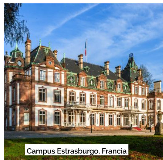
Campus Estrasburgo, Francia