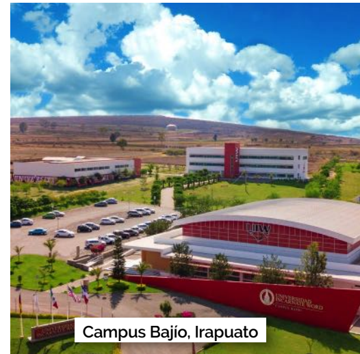
Campus Bajo, Irapuato