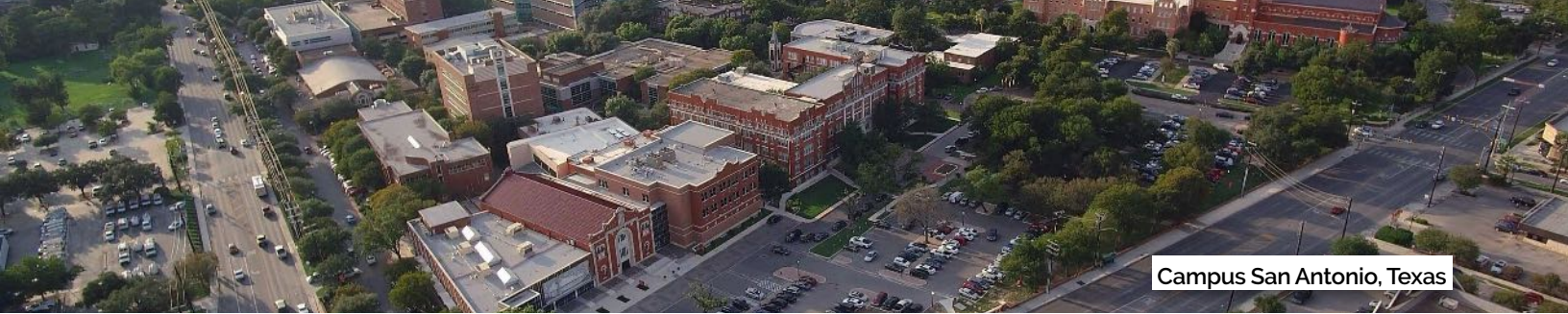
Campus San Antonio, Texas