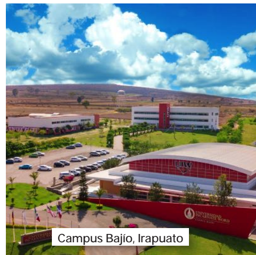
Campus Bajío, Irapuato