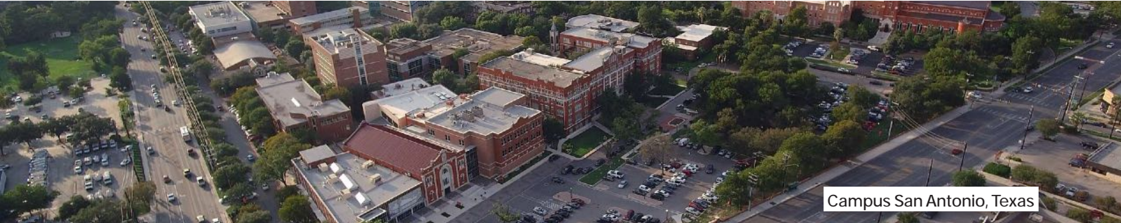
Campus San Antonio, Texas